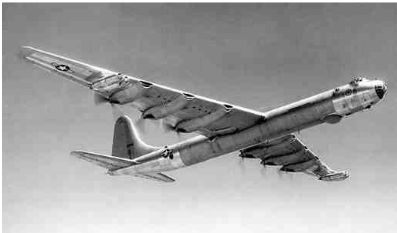
Convair B-36 Peacemaker